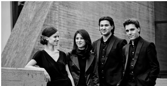
Quatuor Minetti