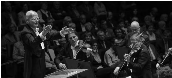
Herbert Blomstedt