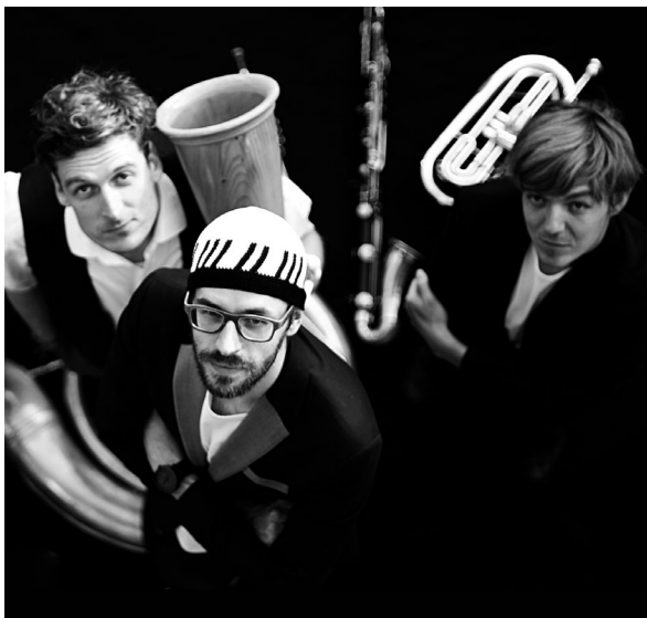
David Helbock Random Control