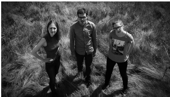
First Gig Never Happened © Hans Klestorfer