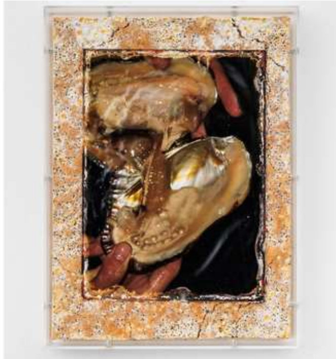
Angelika Loderer, Exposure (2), 2024, plexiglass and c-print, wood, mushroom mycelium